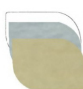
STONDATA mm 35x25