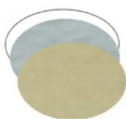
OVALE piccolo mm 30x20