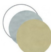
ROTONDA piccola mm 25