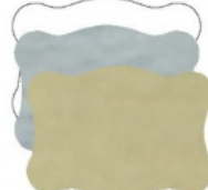
NUVOLA mm 35x25

Etichette disponibili di colore oro, argento o bianche. Stampa ad 1 colore