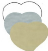
CUORE mm 35x28