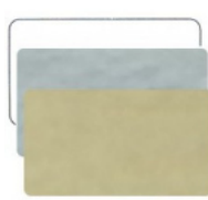
RETTANGOLARE mm 35x22